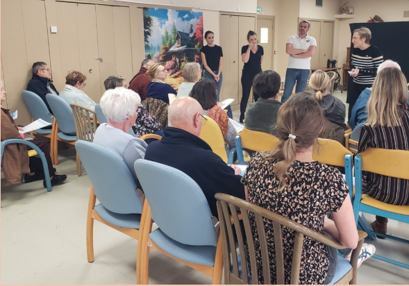
Article réalisé par Annabel Bouffliert du CH de Eu

Dans un premier temps, la compagnie théâtrale « La Belle Histoire » a mis en scène les difficultés quotidiennes auxquelles les aidants peuvent être confrontés. S'en est suivi un débat avec le public au cours duquel des professionnels ont pu présenter les dispositifs de répit existants et répondre aux questions.