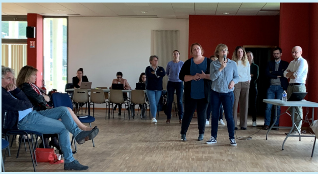
Séminaire de lancement le 17 octobre 2023