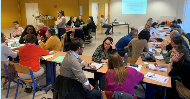
Séminaire de travail le 16 janvier 2024 sur le site de la Résidence du Château pour la déclinaison du projet sur les ESSMS

6 MOIS DE TRAVAIL UNE 50 AINE D'ENTRETIENS INDIVIDUELS PLUS DE 120 PARTICIPANTS 6 GROUPES DE RÉFLEXION