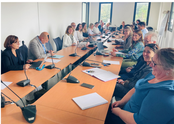
COPIL de lancement du PMSP le 25 septembre 2023