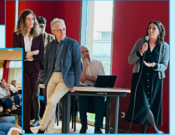
Séminaire de restitution le 12 mars 2024